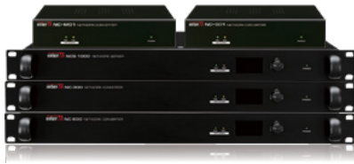
Network Connecting System (NCS)