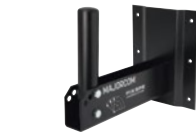
FIX SPE (murale)