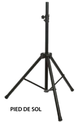
PIED DE SOL