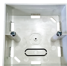
MODULE SAILLIE BA : Boîte pour installation en saillie des prises de la série BA (en option)