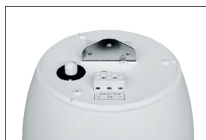
Connecteur et système d'accroche