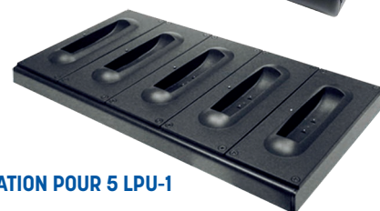
STATION POUR 5 LPU-1