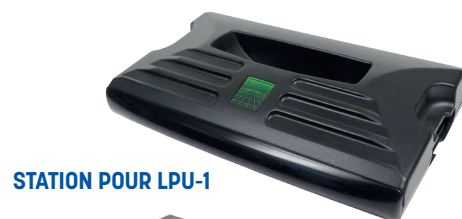
STATION POUR LPU-1