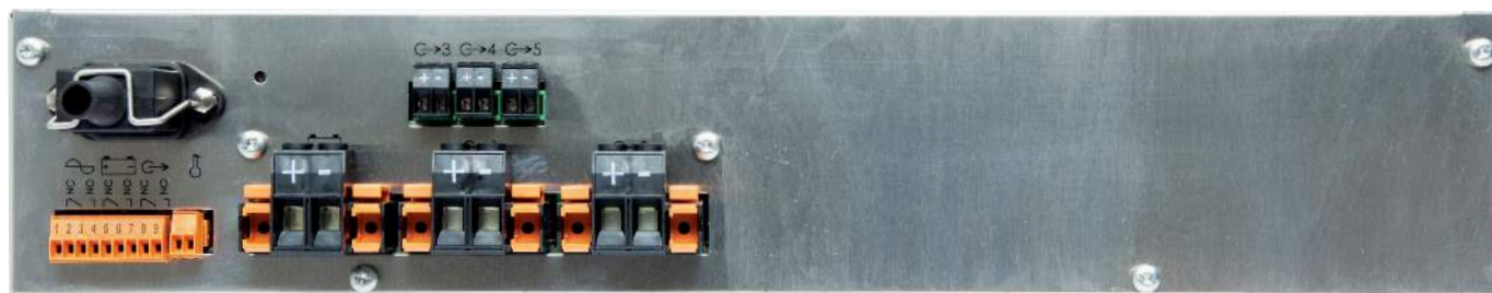
Façade arrière AES 24V/MS40