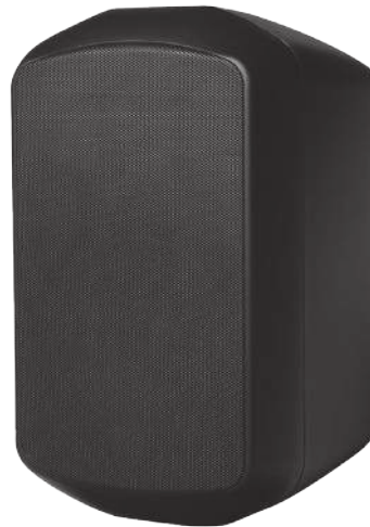
MS 650TB VA (Noir)