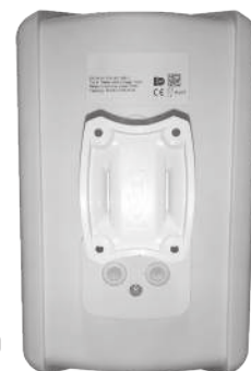
MS 650TW VA (Blanc)