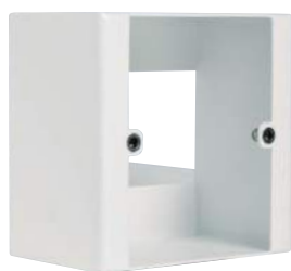
BOITIER VC S : montage en saillie